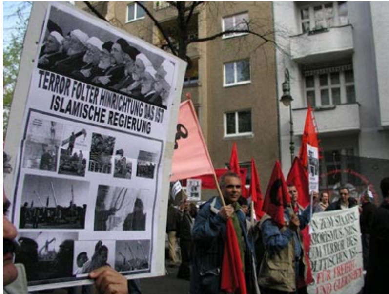
Mord, Terror Hinrichtung, Islamische Regierung

Ein Berliner Gericht, welches später die Terroragenten des Regimes schuldig sprach, verurteilte auch zugleich Khamenei, Rafsanjani und Fallahian als Beteiligte dieses Mordanschlags. Dieses Urteil wurde später auch vom Bundesgerichtshof bestätigt. Das islamische Regime im Iran hat während seiner schändlichen und dunklen 25-jährigen Herrschaft neben der systematischen Unterdrückung der Bevölkerung auch Hunderte politischer Aktivisten und Oppositionsführer durch Terrorakte im Ausland ermordet - so auch 1989 unsere Genossen Gholam Keshavarz (auf Zypern) und Sadigh Kamangar (im Nordirak). Folter, Mord, Hinrichtungen