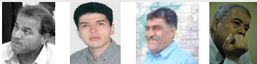
ابراهیم مددی، علی نجاتی، فرزاد کمانگر، منصور اسانلو، صدیق کریمی، فائق کیخسروی باید فوراً از زندان آزاد شوند